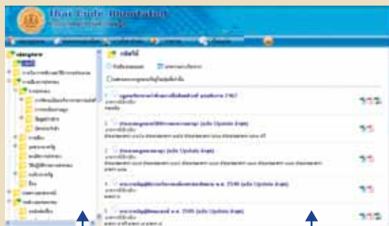
แถบแสดงรายชื่อกลุ่มกฎหมาย