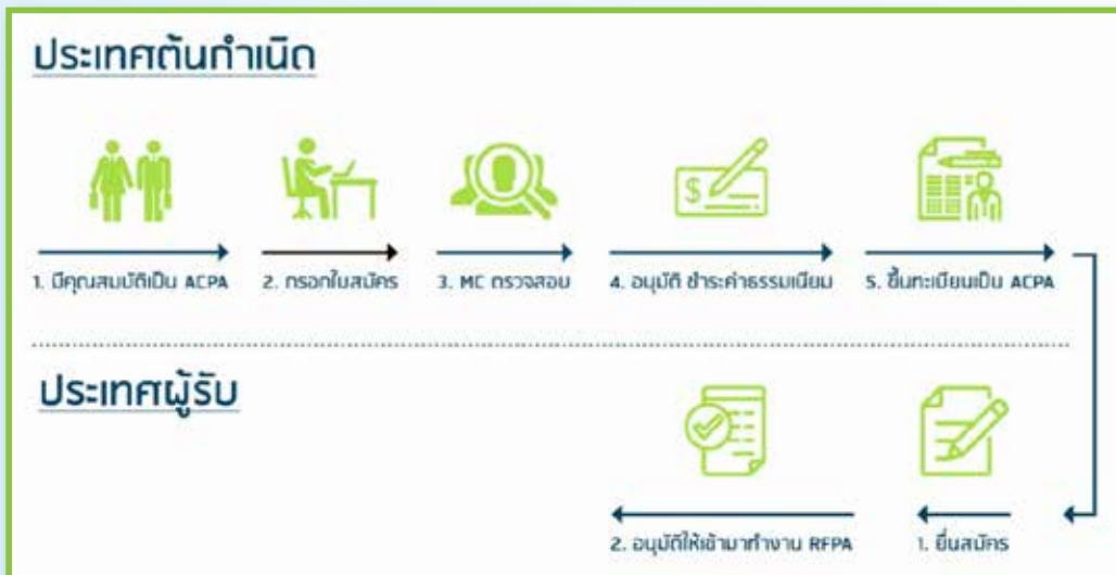
Figure 1 แผนภาพสรุปขั้นตอนการประกอบวิชาชีพบัญชีในอาเซียน อ้างอิง: สภาวิชาชีพบัญชี ในพระบรมราชูปถัมภ์, ( https://www.tfac.or.th/Article/Detail/66936 )

โดยเมื่อพิจารณาหลักเกณฑ์ดังกล่าวข้างต้นแล้ว จะพบว่าประเทศไทยได้มีการออกประกาศกระทรวงแรงงาน เรื่อง กำหนดงานที่ห้ามคนต่างด้าวทำ ๑๘ ลงวันที่ ๑ เมษายน พ.ศ. ๒๕๖๓ โดยอาศัยอำนาจตามความในมาตรา ๗ วรรคหนึ่ง แห่งพระราชกำหนดการบริหารจัดการการทำงานของคนต่างด้าว พ.ศ. ๒๕๖๐ ซึ่งแก้ไขเพิ่มเติมโดยพระราชกำหนดการบริหารจัดการการทำงานของคนต่างด้าว (ฉบับที่ ๒) พ.ศ. ๒๕๖๑ กำหนดให้งานตามที่ระบุไว้ในบัญชีหนึ่ง ๑๙ ท้ายประกาศ หรืองานที่กฎหมายกำหนดให้ผู้ประกอบวิชาชีพต้องมีสัญชาติไทย เป็นงานที่ห้ามคนต่างด้าวทำโดยเด็ดขาดในทุกท้องที่ในราชอาณาจักร ๒๐