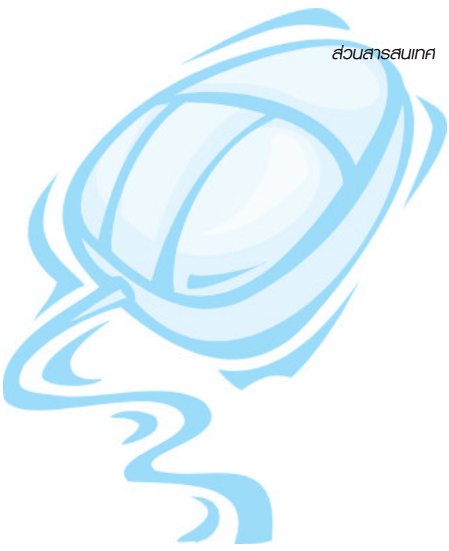
ส่วนสารสุนทศ

การพัฒนาในระบบในครั้งนี้นอกจากมีการแบ่งหมวดหมู่กฎหมายให้สามารถค้นหาและแสดงผลแบบทางเลือกแล้ว ยังพัฒนาระบบสารสนเทศของสำนักงานจาก Krisdika Office ไปสู่ Virtual Law Office และพัฒนาระบบ Digital Library ไปสู่ Virtual Law Library อีกด้วย