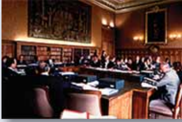
การพิจารณาร่างกฎหมายของที่ประชุมสมาชิกสภา ที่ปรึกษาแห่งรัฐฝ่ายมหาดไทย

เฉพาะเรื่อง ซึ่งผู้ที่จะปฏิบัติหน้าที่ดังกล่าว ได้แก่ สมาชิกที่ปรึกษาแห่งรัฐคนใดคนหนึ่งในฝ่ายที่ได้รับมอบหมายให้รับผิดชอบเรื่องใดเรื่องหนึ่งโดยเฉพาะ