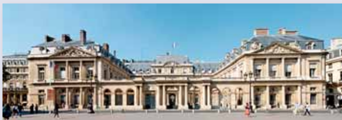
อาคารที่ตั้งของสภาที่ปรึกษาแห่งรัฐ

ป ัจจุบันสำนักงานคณะกรรมการกฤษฎีกาได้ดำเนินการฝึกอบรมและพัฒนาบุคลากรของสำนักงานในด้านต่างๆ อย่างต่อเนื่อง ทั้งบุคลากรในสายงานหลัก คือ สายงานนักกฎหมาย และบุคลากรในสายงานสนับสนุน โดยในเดือนพฤษภาคม ๒๕๕๑ ที่ผ่านมานี้ สำนักงานได้จัดทำโครงการเพิ่มขีดความสามารถในการพัฒนาโยบายและการจัดการภาครัฐ สำหรับข้าราชการสายอำนวยการระดับผู้บังคับบัญชาและผู้บริหารที่รับผิดชอบงานสายอำนวยการ และได้มีการเดินทางไปศึกษาดูงานด้านการบริหารจัดการองค์กรภาครัฐในหลายสถานที่