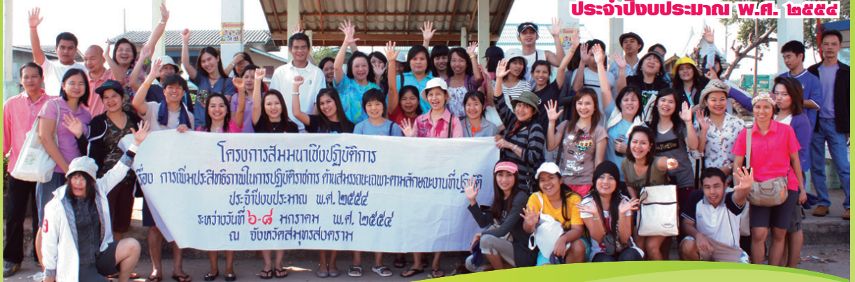
ส่วนการเจ้าหน้าที่ สำนักงานอาคาร

สำนักงานคณะกรรมการกฤษฎีกาได้กำหนดความรู้ความสามารถ ทักษะ และสมรรถนะที่จำเป็นสำหรับตำแหน่งประเภททั่วไป วิชาการ อำนวยการ และบริหาร ตามแนวทางที่สำนักงาน ก.พ. กำหนดให้ส่วนราชการดำเนินการ ซึ่งได้ผ่านความเห็นชอบจาก อ.ก.พ. ของสำนักงานคณะกรรมการกฤษฎีกา ในการประชุมครั้งที่ ๕/๒๕๕๓ เมื่อวันที่ ๒๔ กันยายน ๒๕๕๓ โดยจัดกลุ่มความรู้ความสามารถ ทักษะ และสมรรถนะเฉพาะตามลักษณะงานที่ปฏิบัติ แบ่งออกเป็น ๔ ประเภทตำแหน่ง จำนวน ๑๙ สายงาน ประกอบด้วย